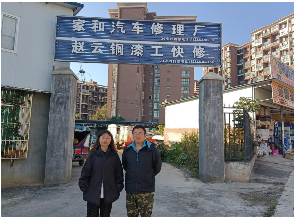
现场全体工作人员