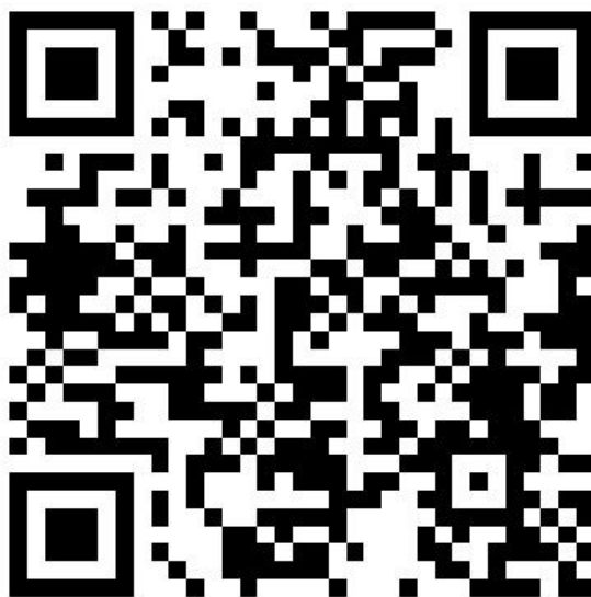
图 4 平台 App 二维码（请使用浏览器进行扫码）

可进入平台后点击左侧 APP 下载安装，也可扫描下方二维码下载（仅支持安卓系统）。