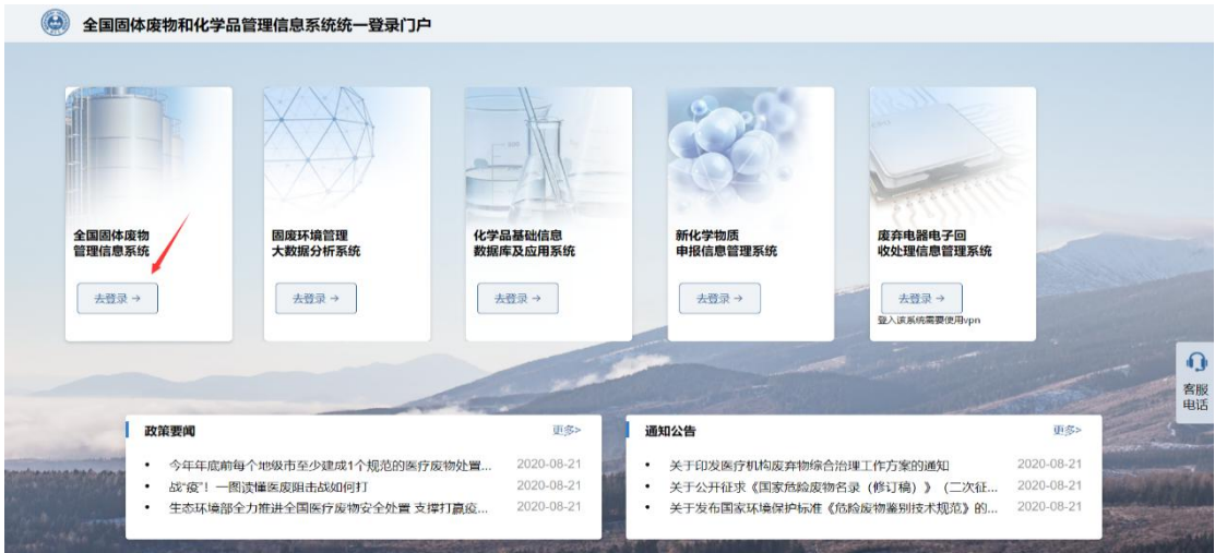
图 1 平台登录首页

打开浏览器（推荐使用谷歌浏览器），输入网址进入登录首页（ https://gfmh.meescc.cn/solidPortal/#/ ，如图 1），选择云南后，输入用户密码（如图 2），登录成功后点击左上角“前往医废系统”即可跳转（如图 3）。