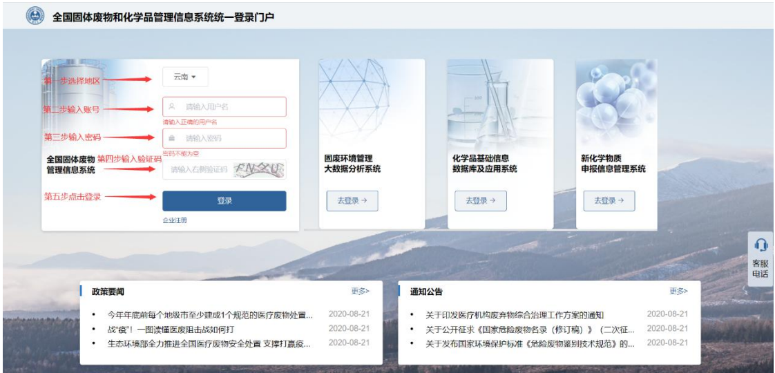
图 2 用户名密码登录页面